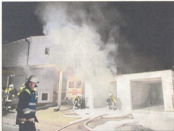
Massenweise Löschschaum: Die Einsatzkräfte der Feuerwehr haben den Autobrand in einer Rohrbacher Garage schnell in den Griff bekommen. Verletzt wurde niemand.

Der Rohrbacher verständigte umgehend die örtliche Feuerwehr, die nur Minuten später mit zwei Löschzügen vor dem Wohnhaus im Bergweg stand. Die Wehr sperrte das Wohngebiet zeitweise ab, setzte Löschschaum ein und brachte den Brand in kurzer Zeit unter Kontrolle. Sie konnte allerdings nicht mehr verhindern, dass der Wagen völlig zerstört wurde. Der Schaden wird trotzdem nur auf rund 500 Euro geschätzt. Wie teuer die Sanierung der außerdem stark beschädigten Garage ausfällt, muss erst noch von Fachleuten geklärt werden. Personen kamen nicht zu Schaden.