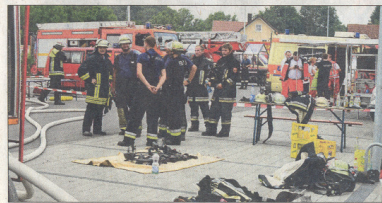
Flammenmeer und Rauchsäule: Der Brand einer Lagerhalle in Reichertshofen hat gestern das Bild und auch die Stimmung der Gemeinde bestimmt. Über 200 Feuerwehrleute kämpften gegen die Flammen, gegen Mittag konnten die Einsatzkräfte erstmals durchschneiden.